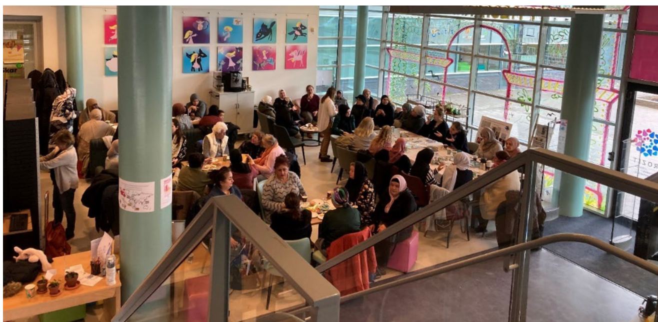
Foto: internationale vrouwendag