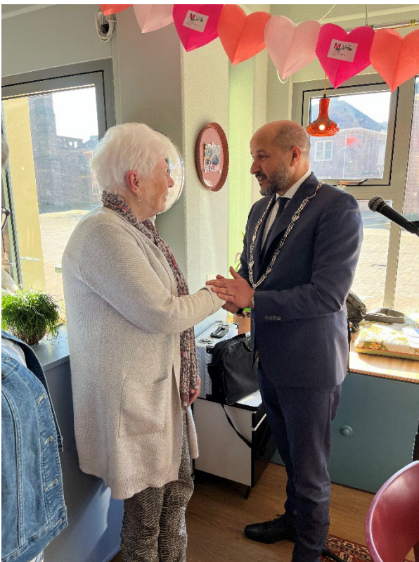
Foto: uitreiking lintje