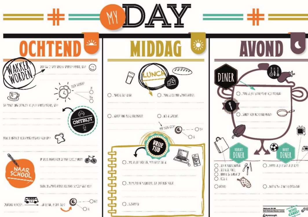
Foto: placemat uit de toolkit Jonge mantelzorgers

Onderdeel van de toolkit, de voorstelling 'What if' werd in diverse klassen en groepen vertoond. Hierbij werd intensief samengewerkt met de jeugdwerkers van Rijnstad.