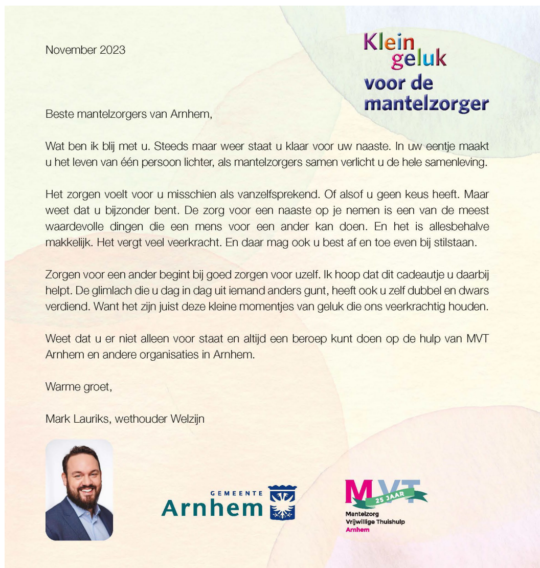
Foto: bericht van de wethouder voor mantelzorgers

Bij het kadootje voor de mantelzorgers zat ook een persoonlijke boodschap van de wethouder aan de mantelzorgers: