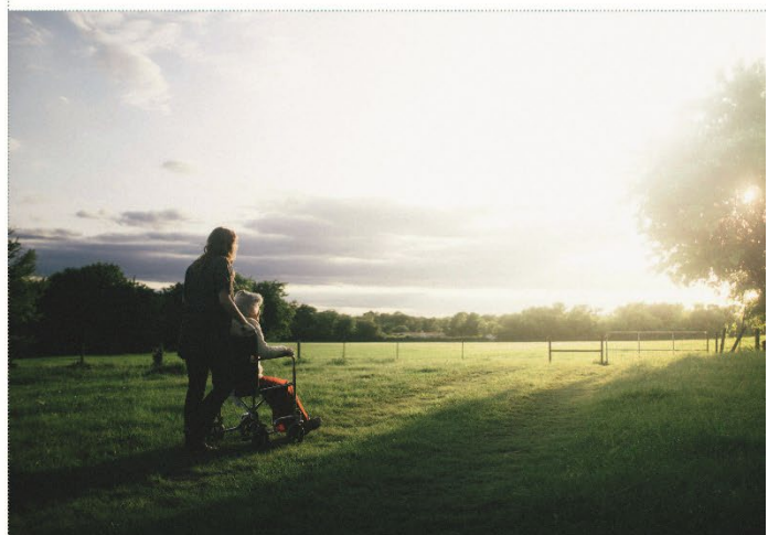
Foto: signaalbericht over werk en mantelzorg

HEEL BELANGRIJK..EIGEN DINGEN BLIJVEN DOEN, VRIENDEN SPREKEN EN VOLDOENDE RUST NEMEN.